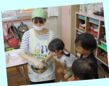
ピーマンの中は どうなっているのかな? みんなの予想は…?