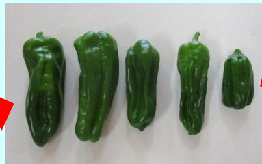
こっちは 赤ちゃんピーマン!